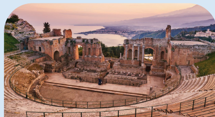
陶尔米纳古希腊剧场