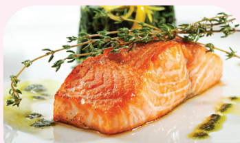
Norwegian Salmon 挪威三文鱼