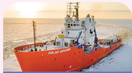
极地破冰探险号巡游