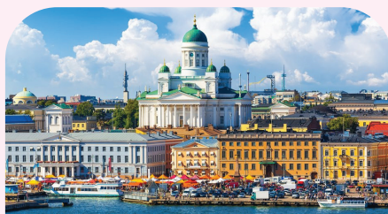
赫尔辛基城市景观