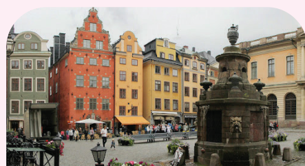
斯德哥爾摩大广场