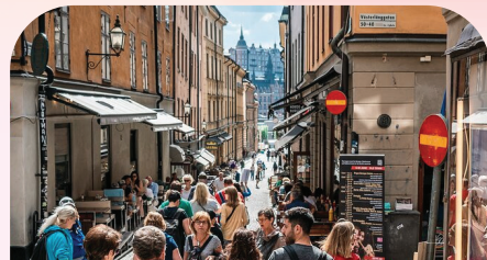
斯德哥爾摩老城区