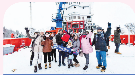
极地破冰探险号巡游