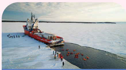
极地破冰探险号巡游