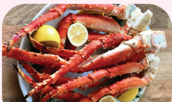
King Crab Leg 帝王蟹腿