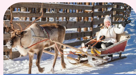
圣诞老人村-驯鹿雪橇