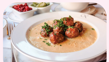
Sweden Meatballs 瑞典肉丸