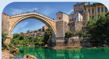
斯塔里莫斯特大桥