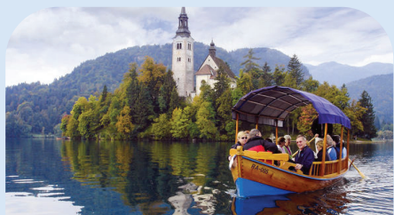
布莱德湖乘坐木船

🏠 HOTEL: Austria Trend Hotel Ljubljana或同等级酒店