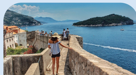
杜布罗夫尼克古城墙