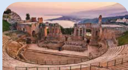
陶尔米纳古希腊剧场