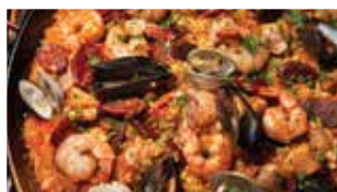
巴塞罗那海鲜饭 Seafood Paella