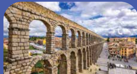
塞哥维亚的罗马引水渠