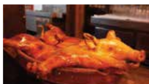
塞哥维亚烤乳猪餐