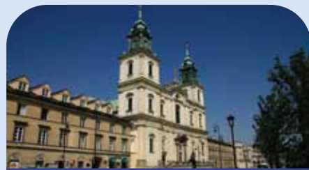
肖邦心脏之圣十字教堂