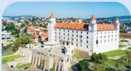
布拉提斯拉瓦城堡