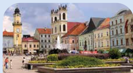
班斯卡-比斯特理察