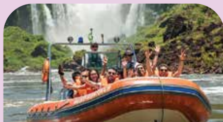
可 (自费) 参加乘坐游艇