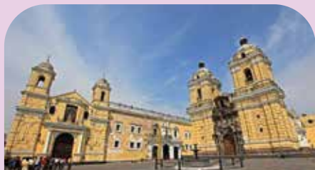
圣弗朗西斯科修道院