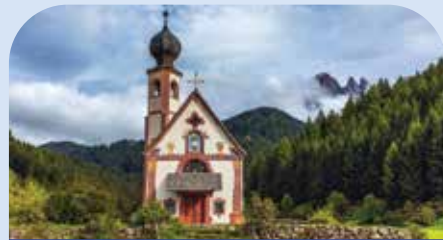
圣玛格达莱娜村教堂