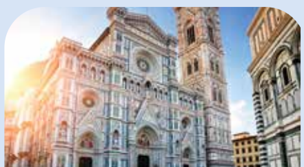
圣母百花大教堂广场