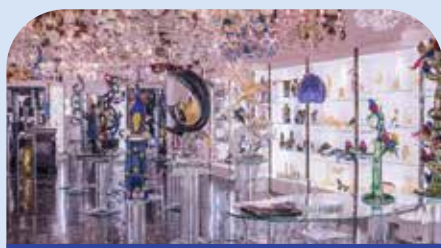
穆拉诺岛玻璃工厂