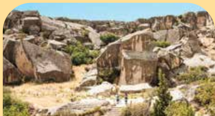
布斯坦岩石艺术文化景观