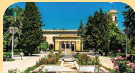
斯大林纪念博物馆