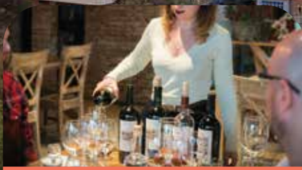
格鲁吉亚葡萄酒品鉴会