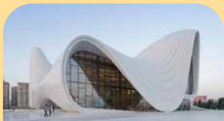
盖达尔·阿利耶夫中心