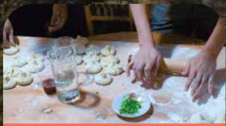
格鲁吉亚饺子制作体验