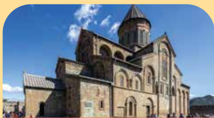
斯维特斯霍韦利大教堂