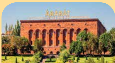
亚美尼亚白兰地工厂