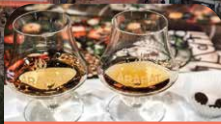
亚美尼亚白兰地品鉴会