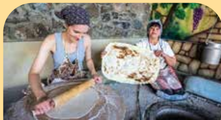
“拉瓦什”(亚美尼亚传统面包)制作班