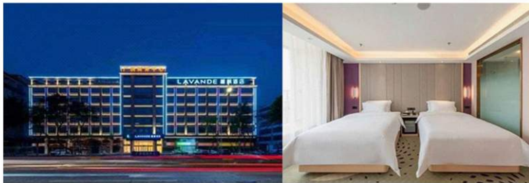
承德丽枫酒店或同级 Lavande Hotel Chengde OR SIMILAR