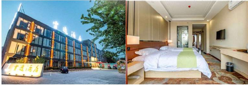
北京云逸酒店或同级 Yun Yi Hotel OR SIMILAR