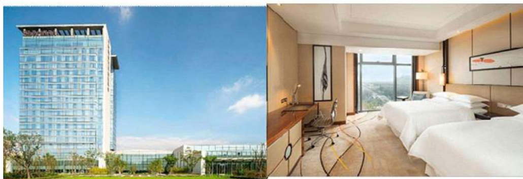
廊坊潮白河喜来登酒店或同级 Sheraton Langfang Chaobai River Hotel OR SIMILAR