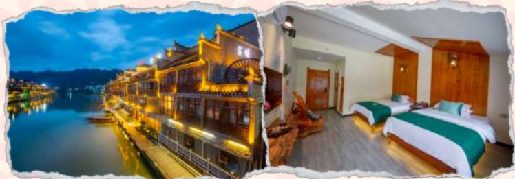
凤凰念樞特色客栈 4星或同级