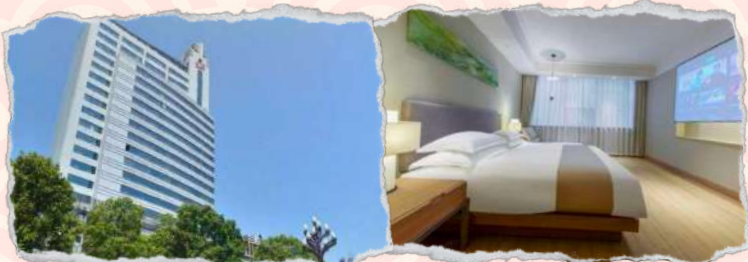
常德汤臣万豪酒店 4星或同级