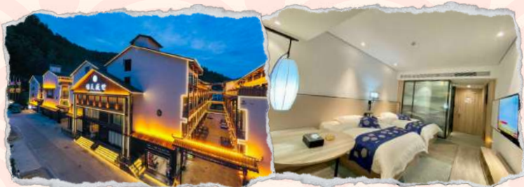
锦天盛世酒店 4星或同级 JinTian ShengShi Hotel or similar class