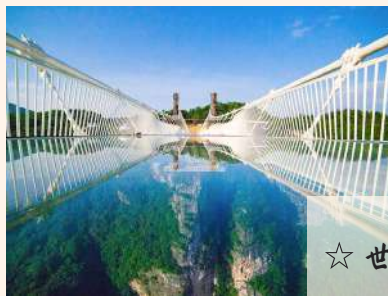
☆ 世界最长悬空玻璃桥