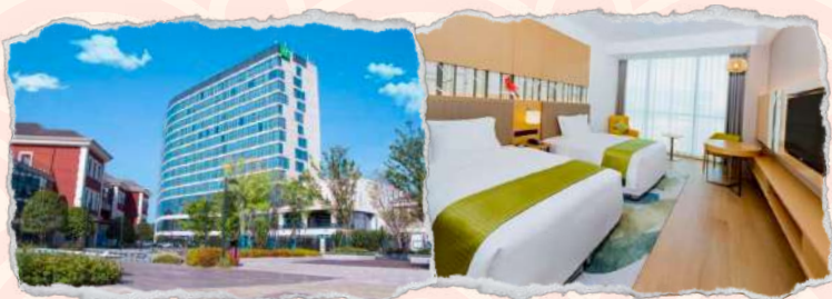
长沙大王山假日酒店 4星或同级 Holiday Inn ChangSha Hotel or similar class