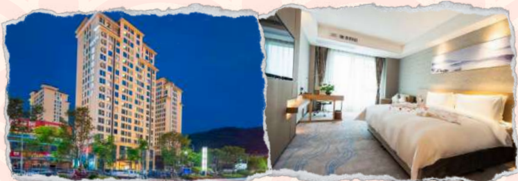
张家界嘉莱特酒店 5星或同级